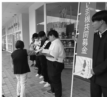
香住高校ボランティア部による街頭募金活動

この期間、区長・自治会長様をはじめ、児童・生徒の皆様、地域の職場や店舗など、町民の皆様にご協力いただきました。ありがとうございました。