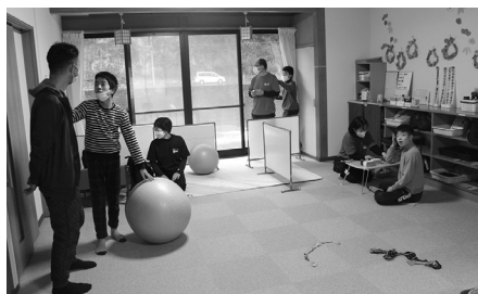
配分先 (放課後デイサービスみつぼしみかた)

お寄せいただいた募金は、援助や支援を必要とされるご家庭、障害者施設・団体へお届けしました。